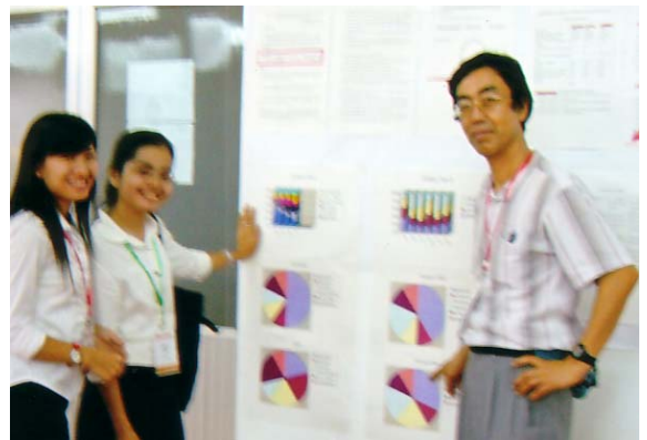
カンボジアの女性教師と

とは言うものの、“Professional development” の分野の発表・ワークショップが盛況で、多くの若い教師が参加していた。また、世界の最貧国の一つに数えられるこの国の教育事情を反映した、例えば、“... but there's no course book! – Creating Materials for Customized Courses” とか、“How to Teach English in Large Classes in Cambodian State Secondary Schools” のような発表がカンボジア人教師によって多くなされてもいた。