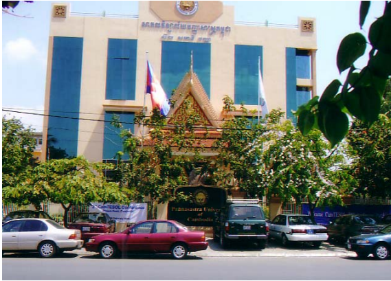
会場のパナサストラ大学

さて、この研究大会は、2回目と歴史は浅いが、その割にはよく組織化され運営されている。オーストラリアの教育 NGO “IDP” が中心となり、カンボジアの教育省及び国内で活動している英語教育団体・個人の協力を得て、企画・組織・プログラムの3委員会が設けられている。また、今回はアメリカ大使館の財政支援により、地方の英語教師が多く参加していた。この大会の趣旨は “to keep the sessions practical and relevant for classroom teachers” である。この研究大会は彼等のために開かれているのだ。参加者の内訳は次の通りである。全体では2日間で延べ760人。530人はカンボジア人、その内地方公立学校教師が135人ということだ。外国人は101人。日本人発表者4人、日本の大学で教えている外国人の発表者5人。その他日本人の一般参加者も数名見られた。発表はワークショップ、ポスターセッション等を含めて全部で113。昨年の50の倍増以上である。